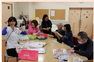
美人スタッフに囲まれて♡(笑)