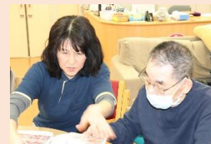
やっぱりツーショット♡