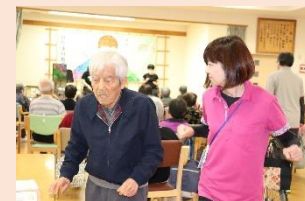
歩行訓練、ボール運動も頑張ってます