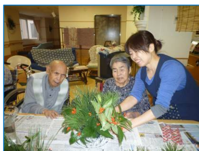
☆お正月用のお華☆松竹梅に百合の花・・これでお正月気分をしっかりと味わえるよね！