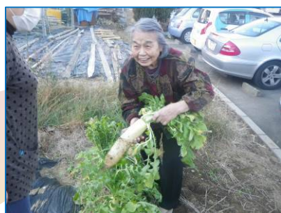
☆施設の野菜畑☆立派な大根ができたね！おせち料理に使うだよ！美味しくできるよ！