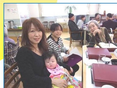
☆心をつなぐ家族会☆ユニットは一つの家族！疑問や不安を解消して信頼関係確立！