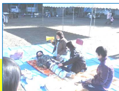
☆地元の防災訓練に参加☆応急手当の講師はこもれびの看護師さん。頼りになります！