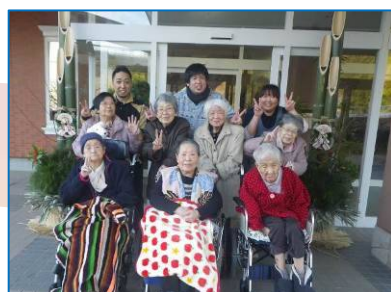
☆いつも見事な理事長手作りの門松☆今年も一足お先に元気でそろって写真が撮れたよ