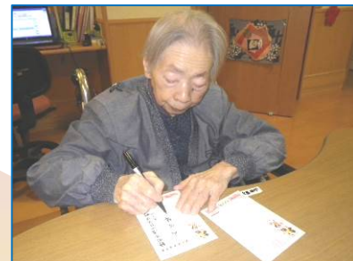
☆心を込めたおばあちゃんの幸せ祈る年賀状☆無事に届いたかな。さすがに姿勢良し！